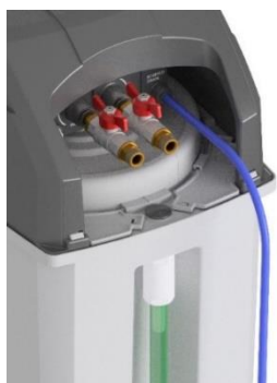
Attacco 3/8" G