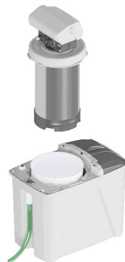
Bombola in acciaio