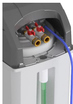
Attacco 3/4" G